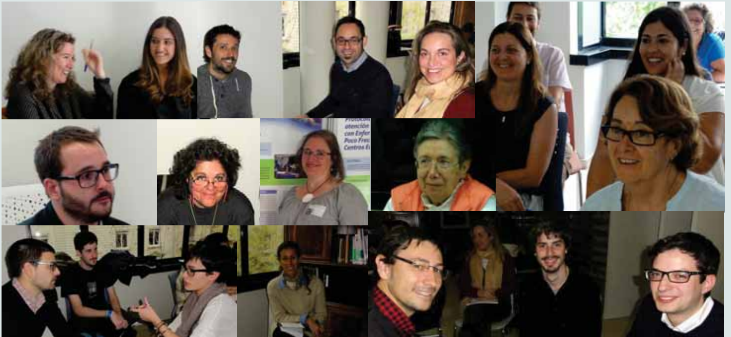
Els professionals de Talita: