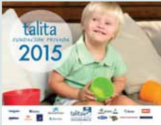
Calendari paret: 29,5 x 23 cm.

El diari LA VANGUARDIA i la revista HOLA! es van encarregar de la distribució. El calendari va tenir una important repercussió en els mitjans de comunicació.